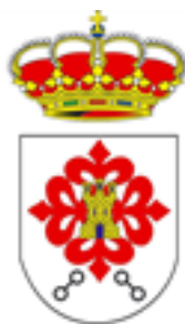
Ayuntamiento de Almagro