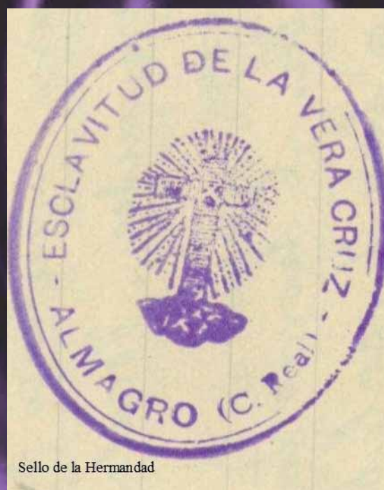
Sello de la Hermandad