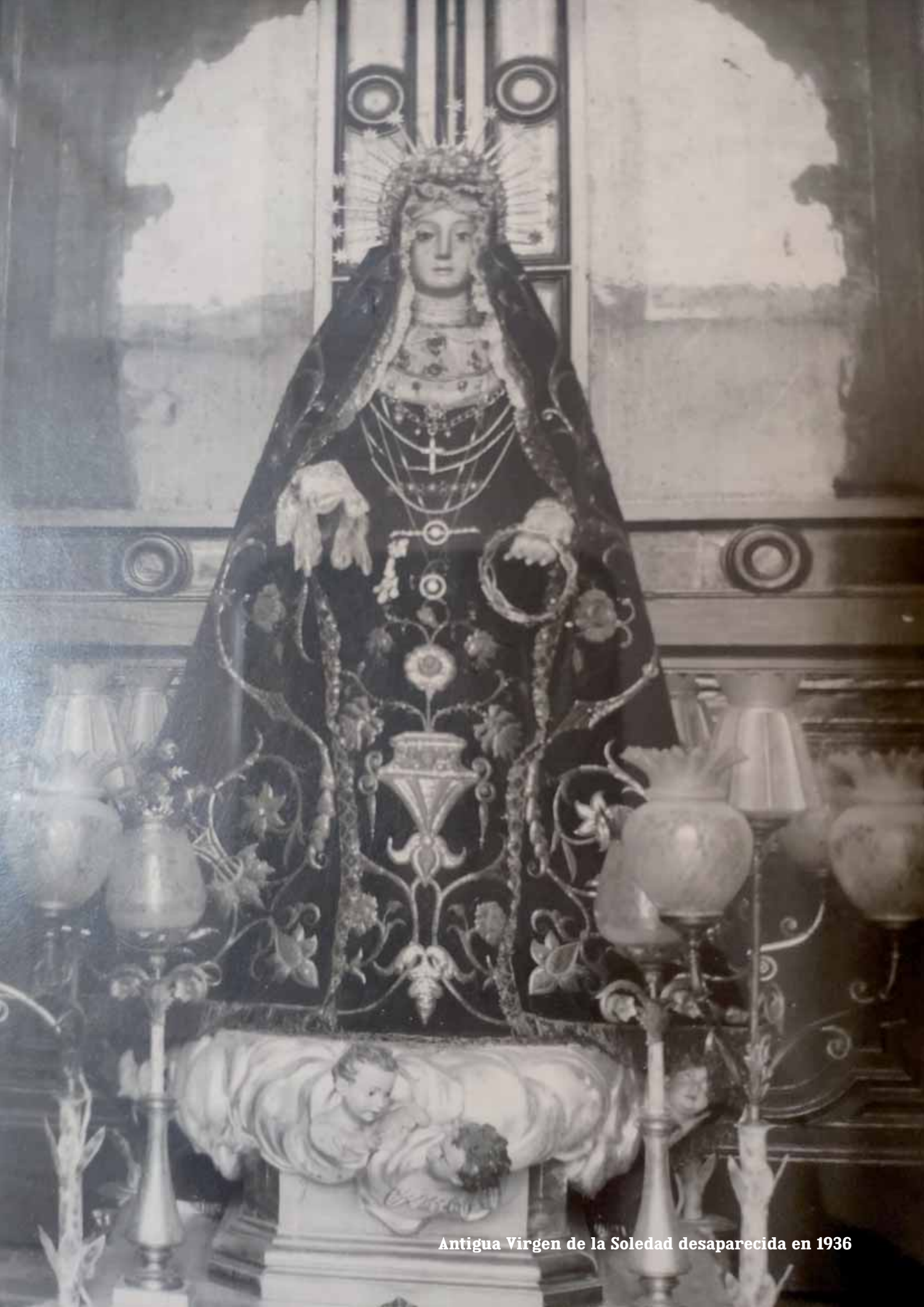
Antigua Virgen de la Soledad desaparecida en 1936