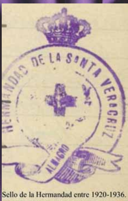
Sello de la Hermandad entre 1920-1936.

Al amanecer al luminoso día de la celebración se encontraban en escombros y ruinas. Confiamos en que la fe católica alumbrara de nuevo y se levantaran vigorosas las tradiciones cristianas” 2 . A partir del 29 de marzo de 1939 se volvió a reorganizar la cofradía. Desde entonces hasta la actualizada la Esclavitud de la Santa Vera Cruz y María Santísima de los Dolores ha ido evolucionando en su andadura hasta llegar a nuestros días.