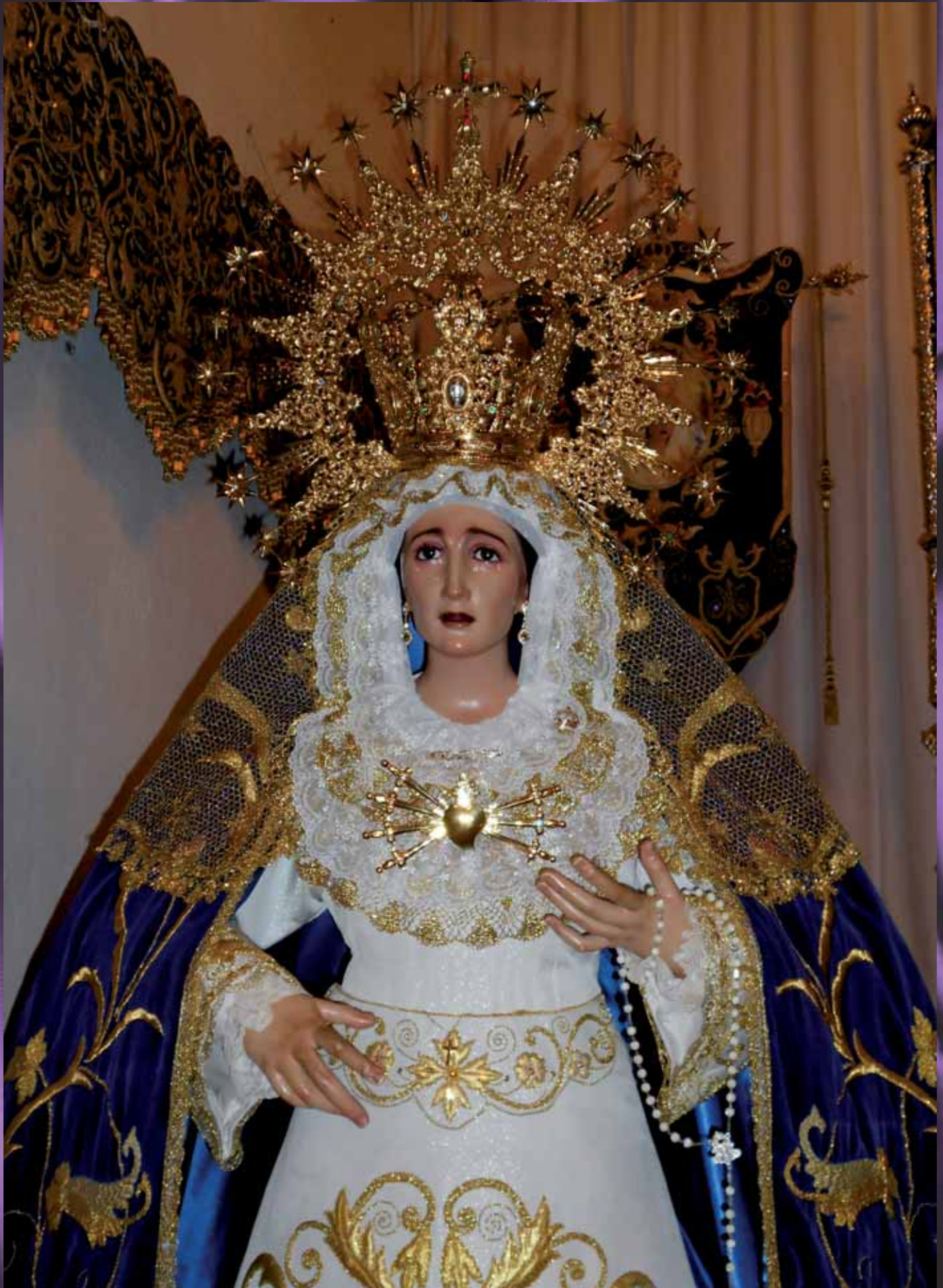
50 Aniversario de Ntra. Sra. de los Dolores. Triduo. Septiembre 2017.