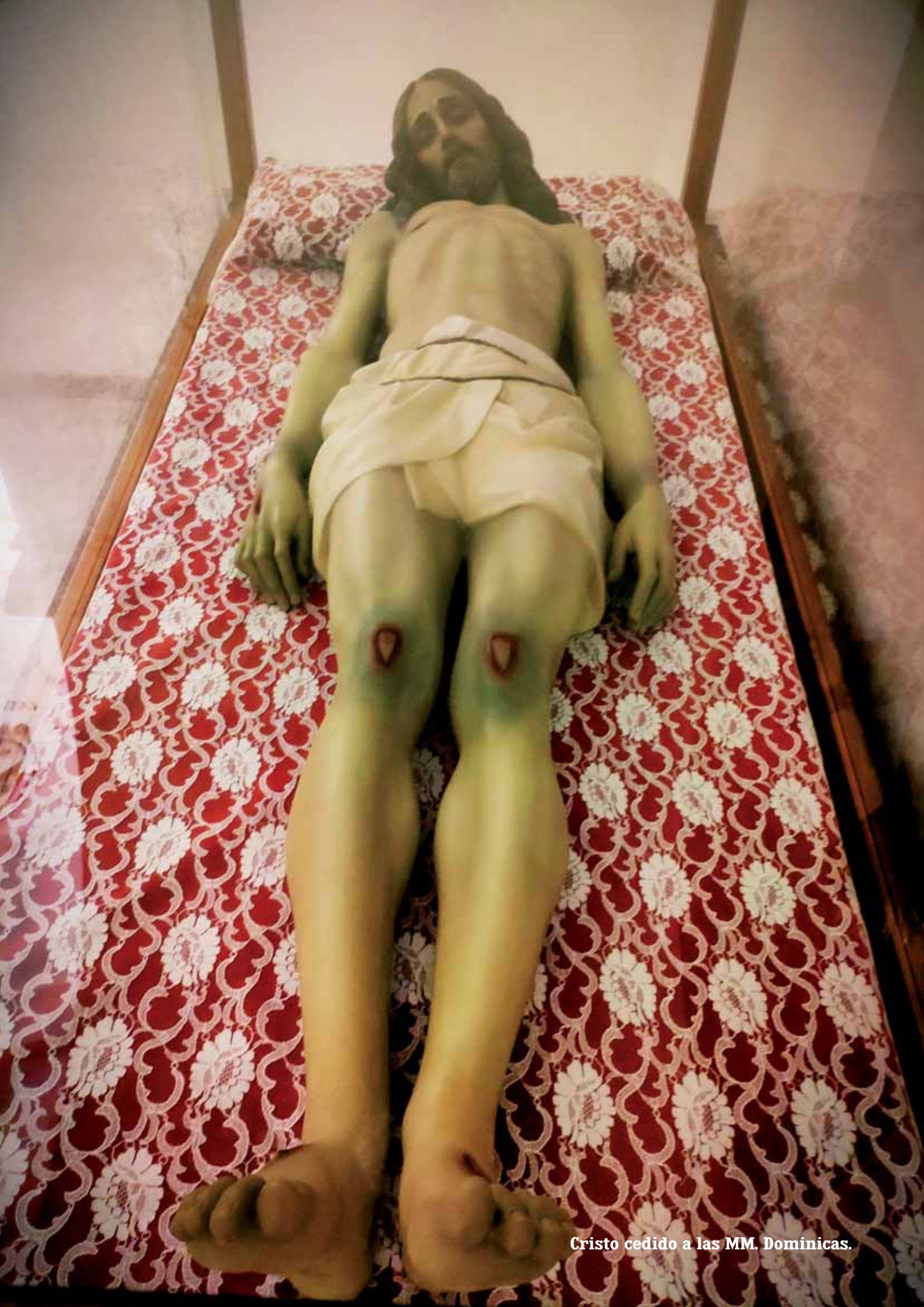
Cristo cedido a las MM. Dominicicas.